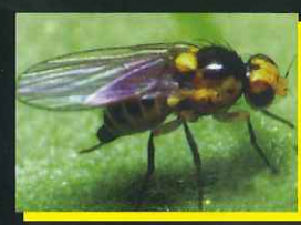
マメハモグリバエ