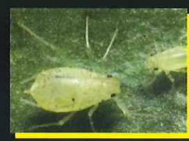
アブラムシ類(有翅)